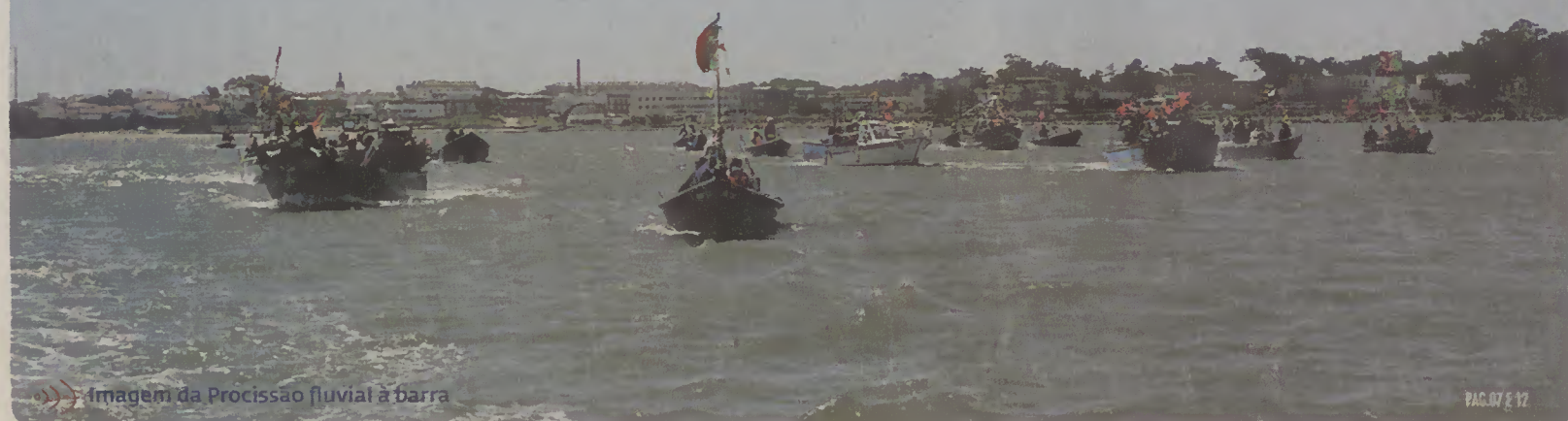
Imagem da Procissão fluvial à barra