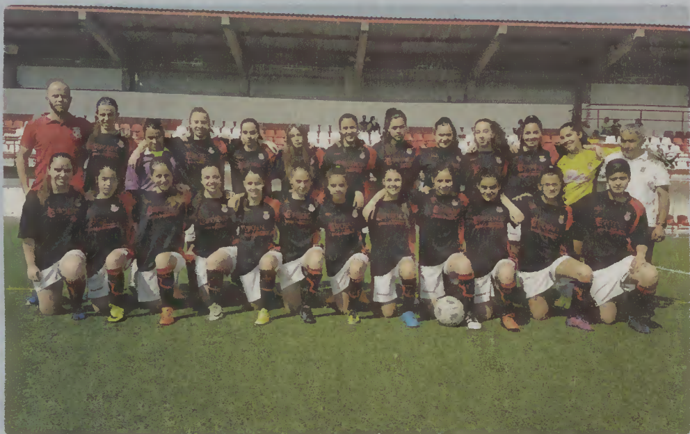
Equipa de Sub-17 de Futebol Feminino (Futebol de 7)