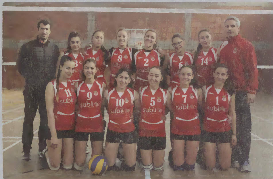
Equipa de Voleibol Feminino