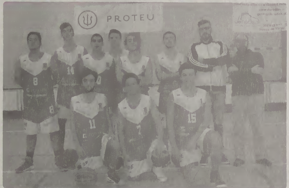
Equipa Sub-18 Masculinos

Sub-18 Masculinos da ADE 2.º lugar na Taça do Minho Sub-14 Masculinos venceram a "final four" da Taça Regional