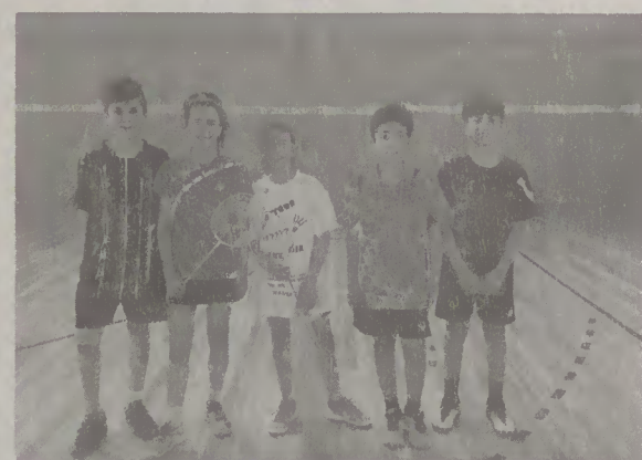
Escalão de infantis