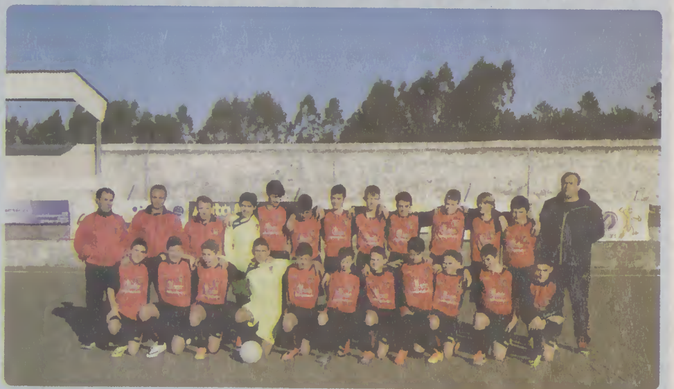
))) Equipa de Futebol Sub-15 - Iniciados - Campeã da série A, 2.a divisão, da A.F. Braga, subiu à 1.a divisão neste escalão