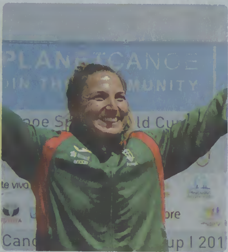
))) Teresa Portela, Medalha de Ouro, em K1 200 metros