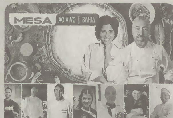
O MAIOR TIME DA BAHIA