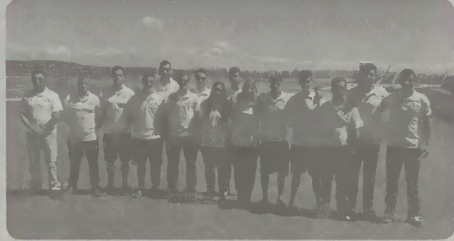
Elementos do G.C.D.R. de Gemeses