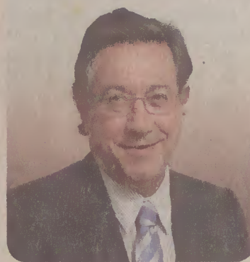
PÁG. 03 /04