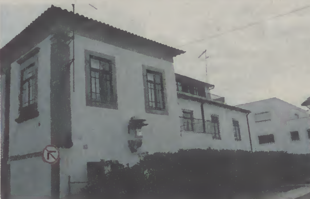
Fachada de edifício com mais de trezentos anos recebe "corpo estranho"