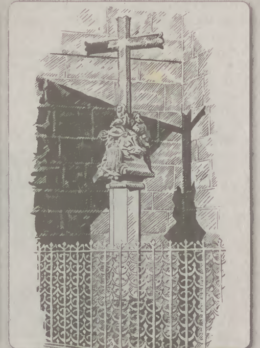
»» Anotação no verso da foto desta imagem (Cidade de Guimarães): Cidade. Cruzeiro de N. S. da Guia, é dedicado a N. S. da Piedade. Sobre o pilar, junto da cruz, tem a Virgem com Cristo morto ao colo, e outras figuras. Primitivamente esteve junto da casa onde nasceu Martins Sarmiento.