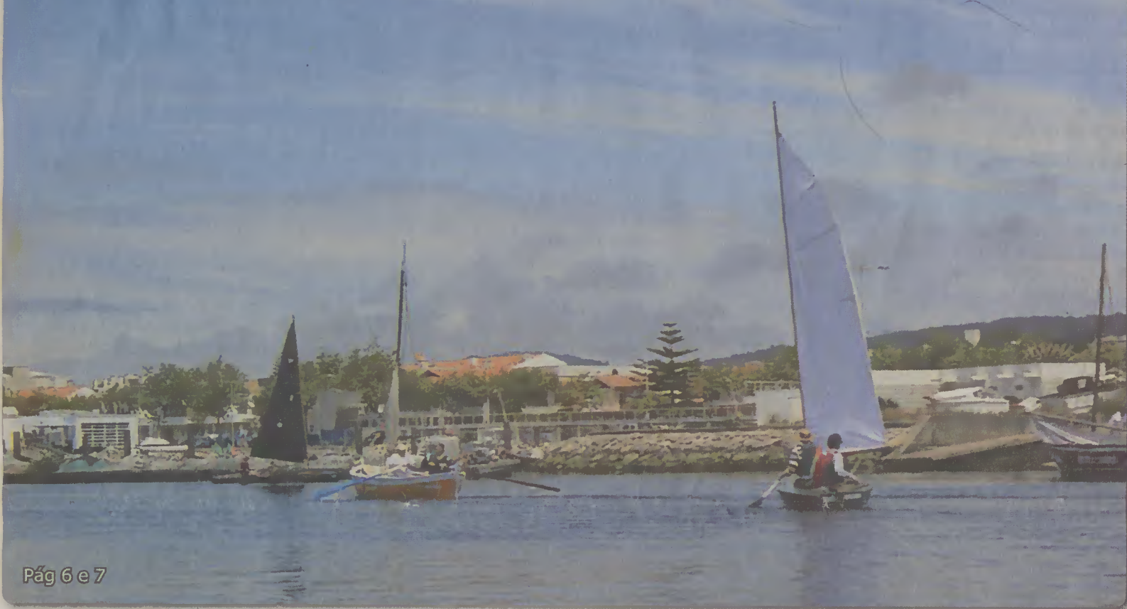
Pág 6 e 7