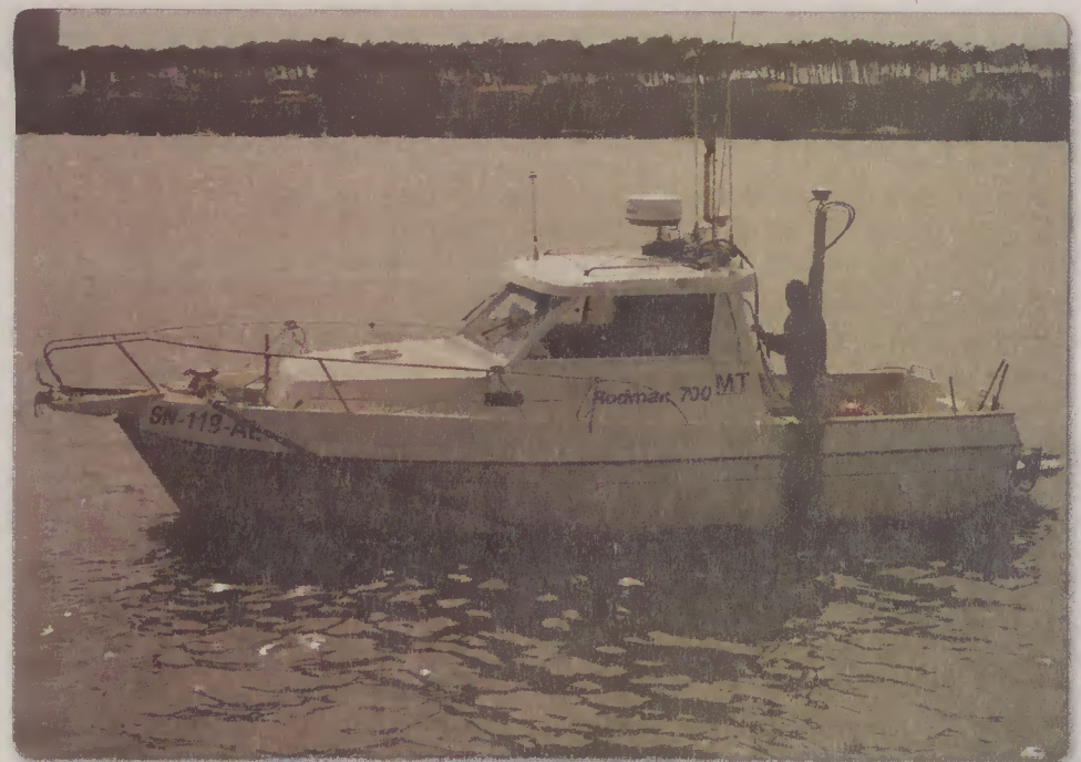
»»» Instituto Hidrográfico em monitorização permanente

Entretanto, assinala-se que o espaço dragado, a denominada Doca de Pesca, estava muito mais poluído e negligenciado do que era visível, pois, soterrados na lama e nos lodos, encontravam-se os mais diferentes objetos, sobretudo afins à faina piscatória, os quais se tornaram obstáculos, por vezes resistentes, para que os trabalhos de dragagem pudessem prosseguir sem dificuldades e mais rápido do que o que se verificou. Lamentamos o que, durante cerca de dezasseis anos, ali foi deixado e desleixado, pelo que, doravante, todos os responsáveis, com particular incidência os utentes deste espaço, devem zelar convenientemente uma infra-estrutura que, afinal, é de todos.