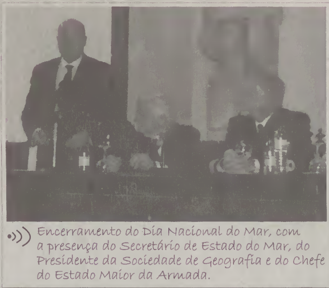
Encerramento do Dia Nacional do Mar, com a presença do Secretário de Estado do Mar, do Presidente da Sociedade de Geografia e do Chefe do Estado Maior da Armada.

representado a cultura marítima do concelho de Esposende em vários pontos do país e sobretudo nos encontros de embarcações tradicionais