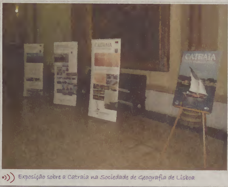
Exposição sobre a Catraia na Sociedade de Geografia de Lisboa

destaca a criação de um prémio literário para valorizar o que há escrito sobre o mar e os rios e apontou que efemérides como o Dia da Água, o Dia Nacional do Mar, o Dia do Pescador, entre outras, sejam assinaladas com visibilidade no âmbito da Rede Nacional da Cultura dos Mares e dos Rios, através de eventos e publicações. Durante a sua intervenção, o autarca defendeu sempre que «Esposende tem desenvolvido um intenso trabalho em prol dos mares e dos rios», que considera «um valioso e inestimável património», de que são exemplos o Banho Santo da Romaria de S. Bartolomeu do Mar; a Rede de Museus do Mar de Esposende (MUMAR-E); o Projeto Esposende, terra