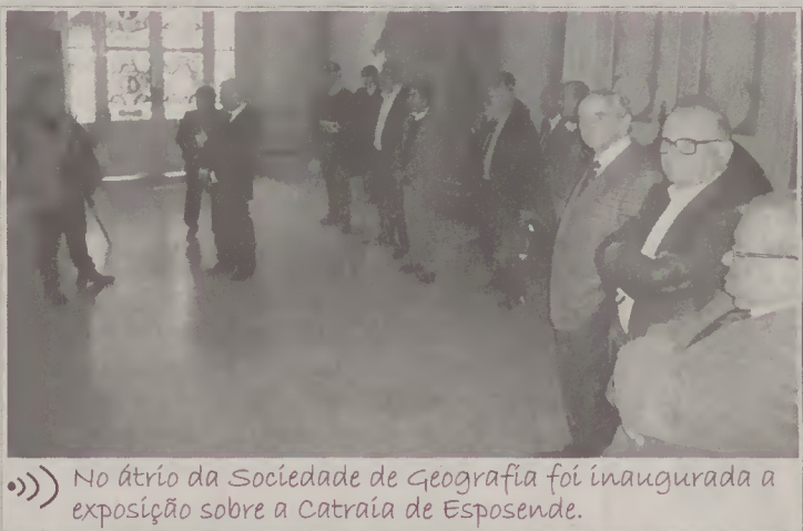
No átrio da Sociedade de Geografia foi inaugurada a exposição sobre a Catraia de Esposende.

do Mar. No cair da noite, a “Catraia de Esposende” regressou a terras do norte, rumo ao Museu Marítimo de Esposende onde aguarda mais uma singradura em prol da Cultura dos Mares e dos Rios.