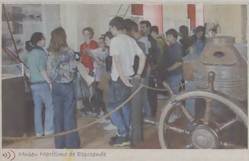
Museu Marítimo de Esposende