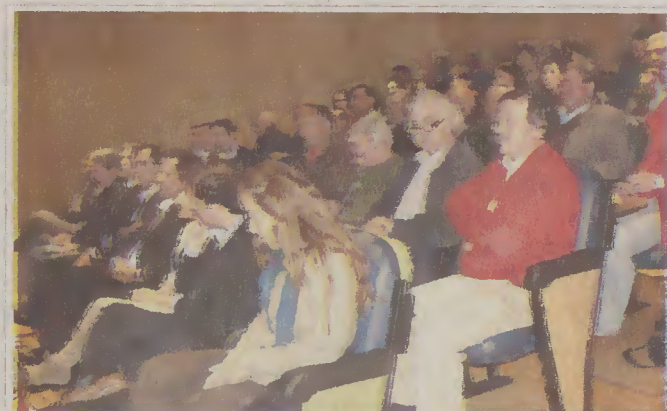
Tendo em conta o elevado interesse nestas matérias para a população em geral, a ACHLI tem intenção de realizar colóquios semelhantes noutros concelhos, onde a coexistência Homem/Lobo é significativa.

Segundo a investigadora, este projeto de monitorização já permitiu recolher 800 amostras não evasivas, capturar 17 lobos, dos quais 15 são segui-