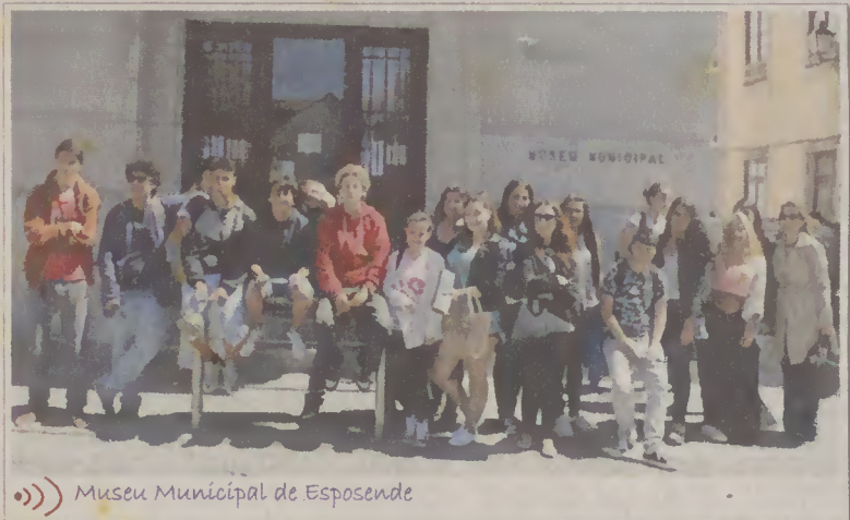
Museu Municipal de Esposende

e Esposende, ilustrados pelos documentos, mapas e fotografias expostos ao longo do percurso expositivo. Estas visitas contribuíram certamente para o enriquecimento cultural dos alunos!