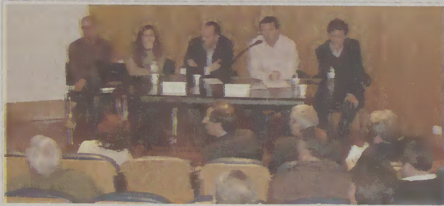
No final da sessão, a plateia presente teve oportunidade de debater com os oradores convidados alguns dos assuntos falados.