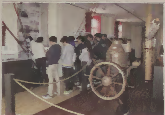
Grupo de alunos da ESHM durante a visita guiada.

18, Dia Internacional dos Museus, o Museu Marítimo de Esposende esteve aberto ao público, gratuitamente, entre as 14h30 e as 18.00h, tendo ocorrido muitos esposendenses a visitá-lo. Por curiosidade, refira-se que, até à data, em termos de visitas ao Museu, maio é já o melhor mês do ano de 2013