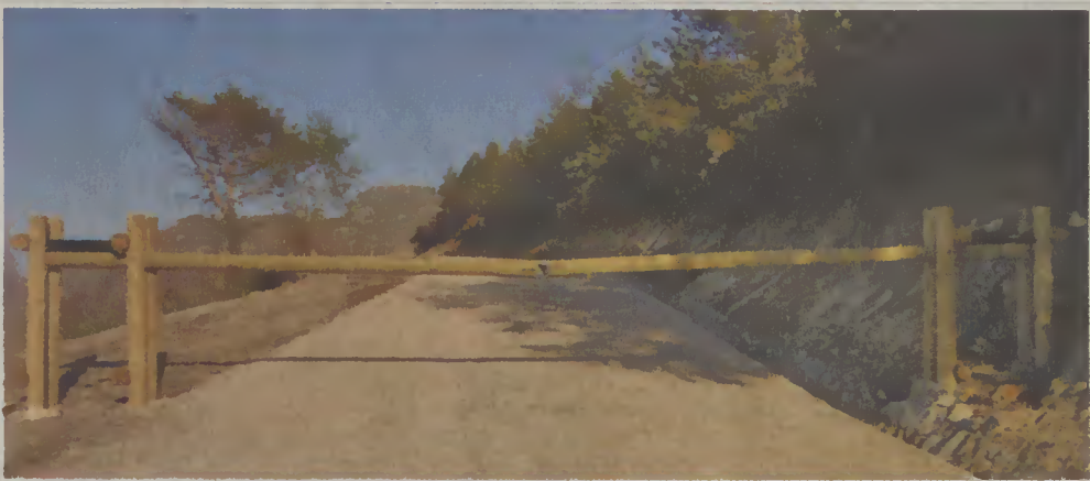
Condicionamento do Trânsito na área do Parque Eólico através da colocação de cancelas.

Adicionalmente, e na perspetiva dos dois investigadores, outras medidas de conservação devem ser também asseguradas, tais como a instalação, a melhoria e a consolidação de áreas florestais, o fomento de presas selvagens para o lobo (corço ou veado), como forma de diminuir o ataque a ungulados domésticos, e ainda a minimização e a prevenção dos ataques do lobo a efetivos pecuários, através da eficaz proteção dos rebanhos, com cães de gado e cercas elétri-