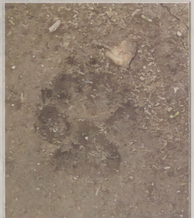
A deteção de indícios do Lobo é uma das metodologias usadas nos Projetos de Monitorização.

didadas compensatórias, a aplicar pelos promotores dos projetos. Contudo, e tendo em conta que esses promotores não se encontram vocacionados para o desenvolvimento de planos de índole ambiental, a execução dessas medidas é efetuada por instituições criadas para esse fim, como é o caso da Associação de Conservação do Habitat do Lobo Ibérico. Neste contexto, e para além da panóplia de planos vocacionados para a melhoria