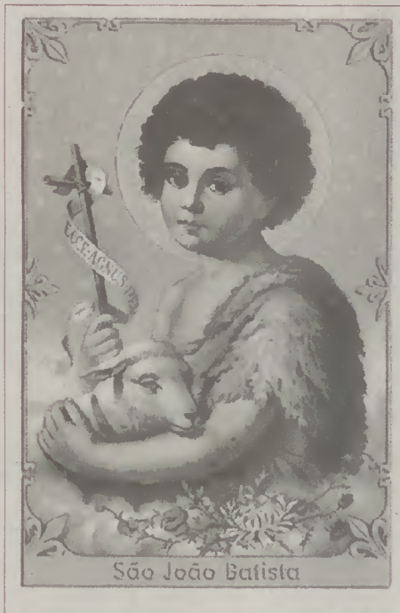
São João Batista

19h00 - Missa na Capela, em honra de São João.