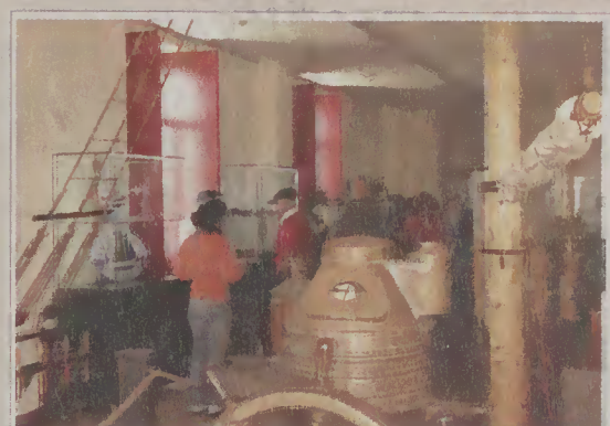
Associados do Clube Automóvel Clássico e Antigo de Vila Nova de Famalicão durante a visita guiada.