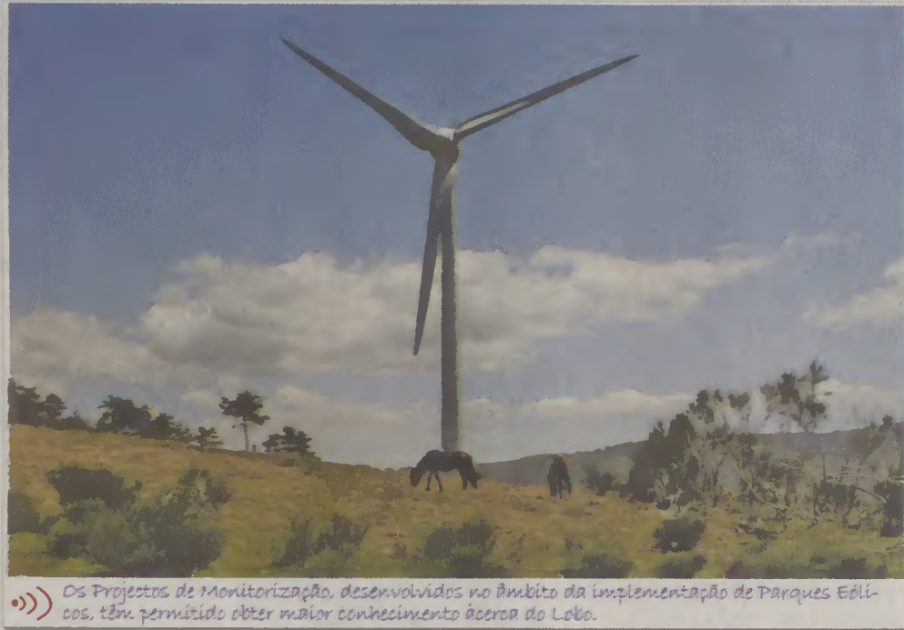
Os Projetos de Monitorização, desenvolvidos no âmbito da implementação de Parques Eólicos, têm permitido obter maior conhecimento acerca do Lobo.

Embora a coordenação geral dos projetos de monitorização desenvolvidos seja da responsabilidade da ACHLI, a componente técnico-científica e a respetiva execução são asseguradas por duas entidades distintas: Centro de Investigação em Biodiversidade e Recursos Genéticos da Universidade do Porto (CIBIO-UP) e Departamento de Biologia da Universidade de Aveiro (DBio-UA). Estas entidades têm como objetivo a identificação, a avaliação e o estudo de determinados aspetos da população lupina, que se