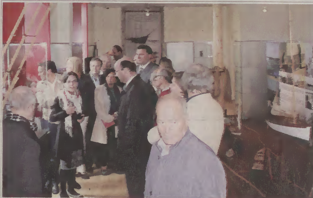
Visita ao Museu Marítimo.

Joana Laranjeira