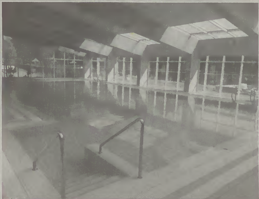
Piscina Municipal de Forjães

Nas Piscinas Foz do Cávado foram intervenções os balne-