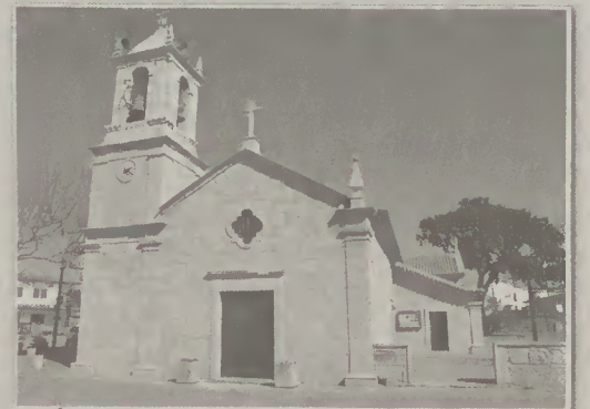
» Igreja Paroquial de Gandra