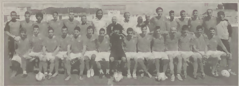
ADE, segunda equipa concelhia que garantiu a manutenção na III Divisão Nacional

Contamos poder divulgar, em próxima edição, os últimos resultados e as classificações finais alcançadas pelas diferentes equipas concelhias que participaram nos campeonatos das camadas jovens, da A.F. de Braga