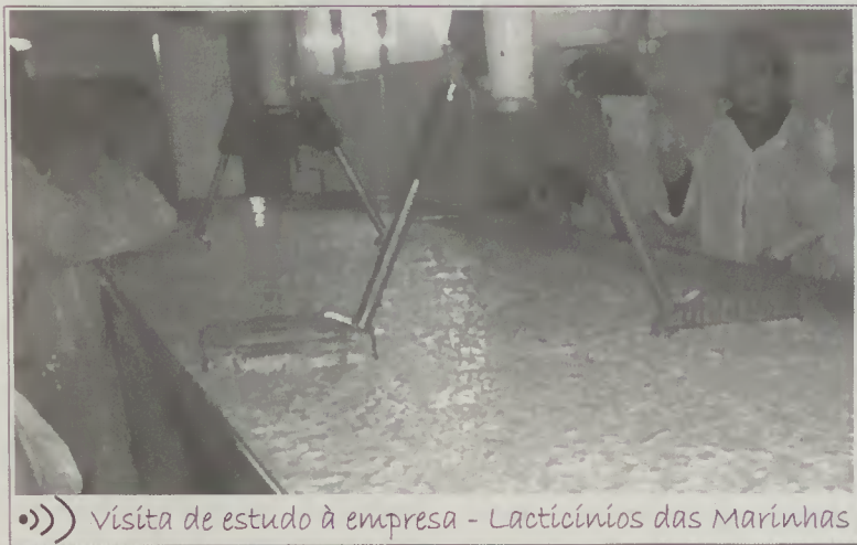
»»» Visita de estudo à empresa - Lactínios das Marinhas

seleccionados, obedecendo a um factor comum, a grande qualidade dos serviços prestados e dos produtos obtidos. Das entidades visitadas, destacamos as seguintes: Empresa "Diatosta", em Aveiro; Indústria de Conservas "Ramirez", em Matosinhos; Lactínios das Marinhas; Exploração Agrícola de Produção de