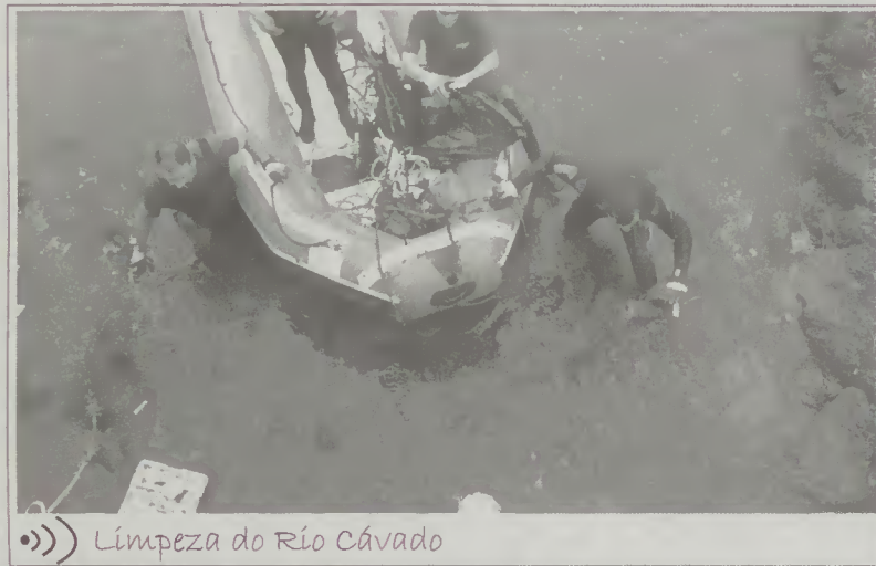
Limpeza do Rio Cávado

Ainda no Dia Mundial do Ambiente, foi levada a cabo a iniciativa "1001 mergulhos pelo ambiente", que se enquadra no âmbito do protocolo de cooperação entre a Autarquia, a Esposende Ambiente, a empresa Águas do Cávado e a Associação Forum Esposendense e que se traduziu numa limpeza simbólica do leito do rio Cávado, na zona junto à marina, com o principal objectivo de alertar os munícipes para a necessidade de proteger e preservar os recursos hídricos.