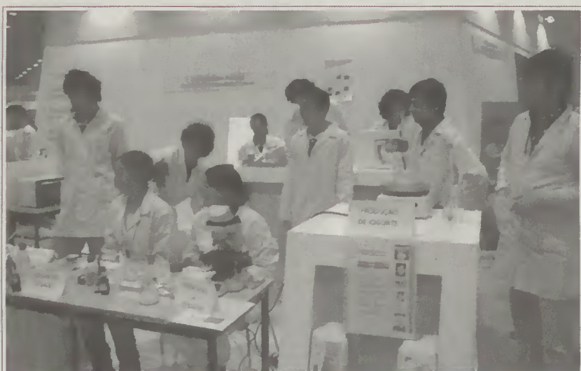
»»» Participação dos alunos do 2º e 3º anos do Curso Profissional "TPCQA" na Feira da Juventude, Qualificação e Emprego "Futurália 2010" que decorreu em Lisboa, na FIL.

Nestas diferentes entidades, com o apoio imprescindível dos monitores das empresas e