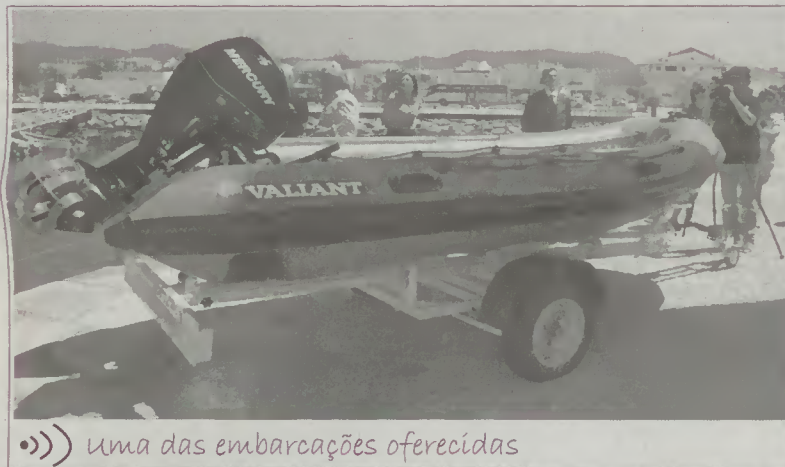
Uma das embarcações oferecidas