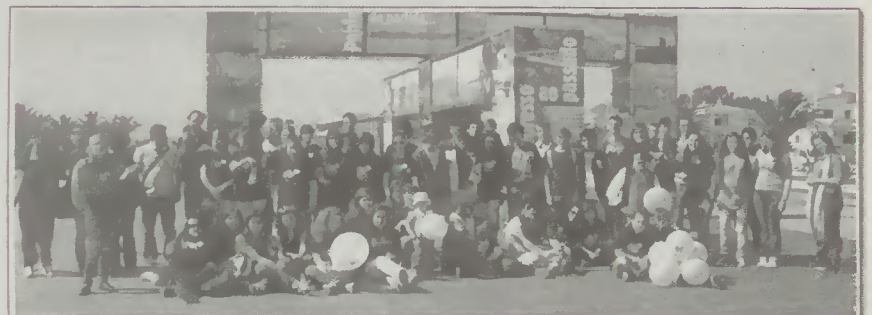
Actividade "1001 cores pelo ambiente"

Outra das actividades foi a iniciativa "1001 cores pelo ambiente", desenvolvida com a