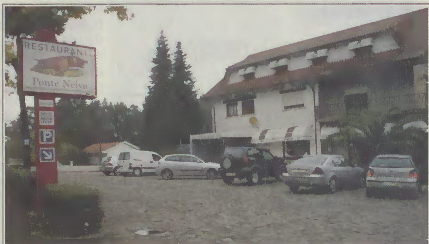
Restaurante Ponte Neiva, em Neiva, Viana do Castelo

segredos, a qualidade começa na selecção dos animais, nos temperos, mas é no tempo da assadura que está o grande segredo. Aqui, não leves a mal, sou teu amigo, mas não vou revelar".