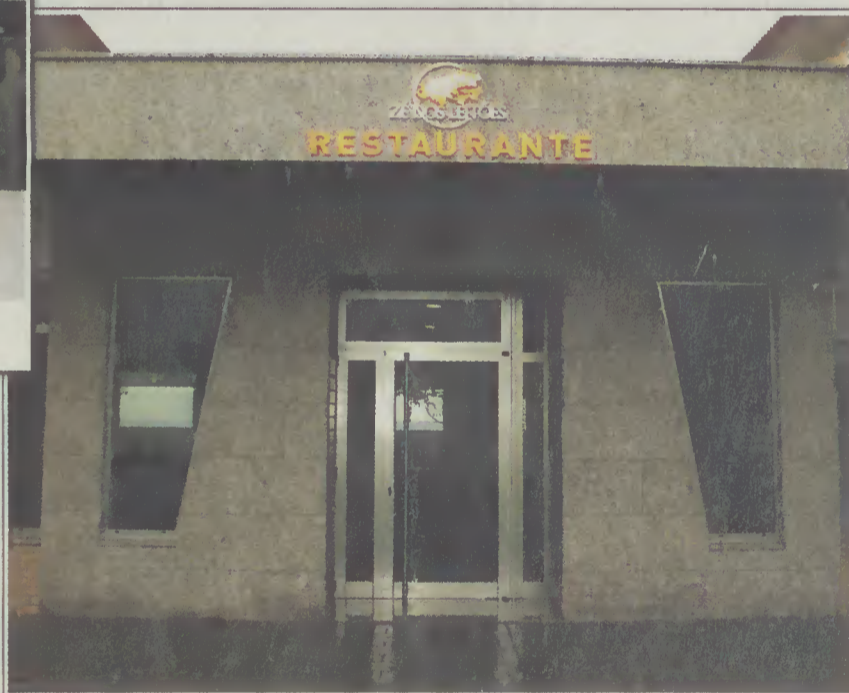
Restaurante Zé dos Leitões, em Forjães, Esposende