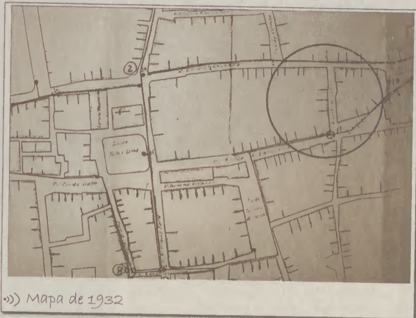
Mapa de 1932

Estamos certos ter sido por esta ocasião que se atribuiu o nome àquela rua de Rua Luís de Camões.