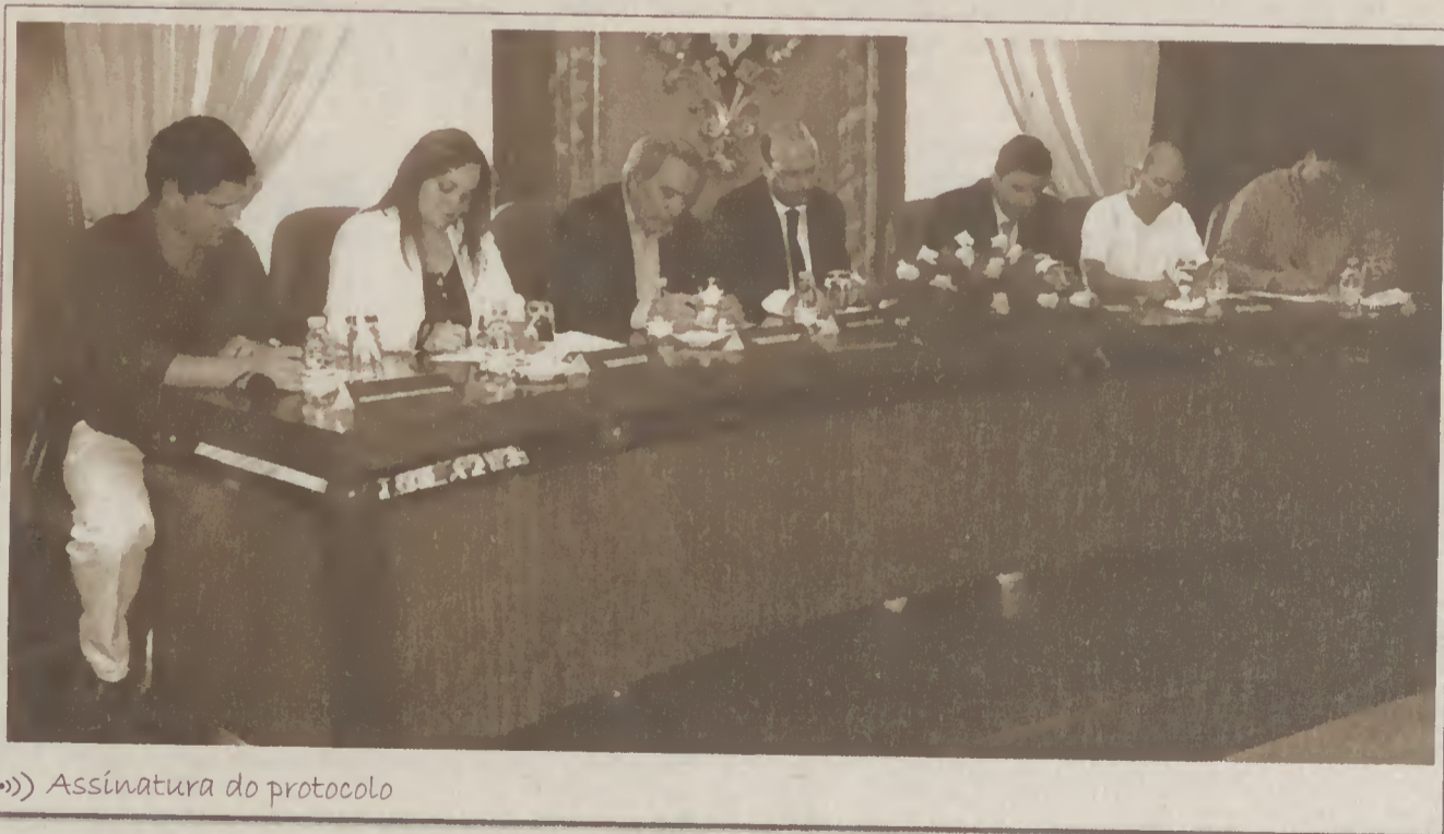
Assinatura do protocolo

No que respeita à Câmara Municipal, serão executados, ao abrigo do URBI, os seguintes projectos: Requalificação urbana dos bairros