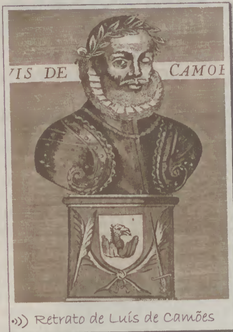
Retrato de Luís de Camões