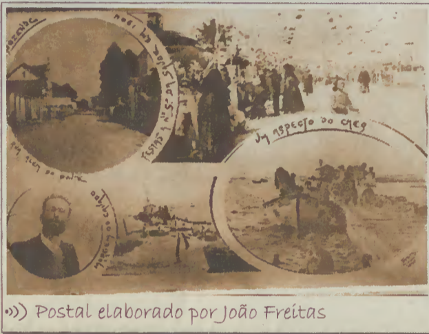
»»» Postal elaborado por João Freitas