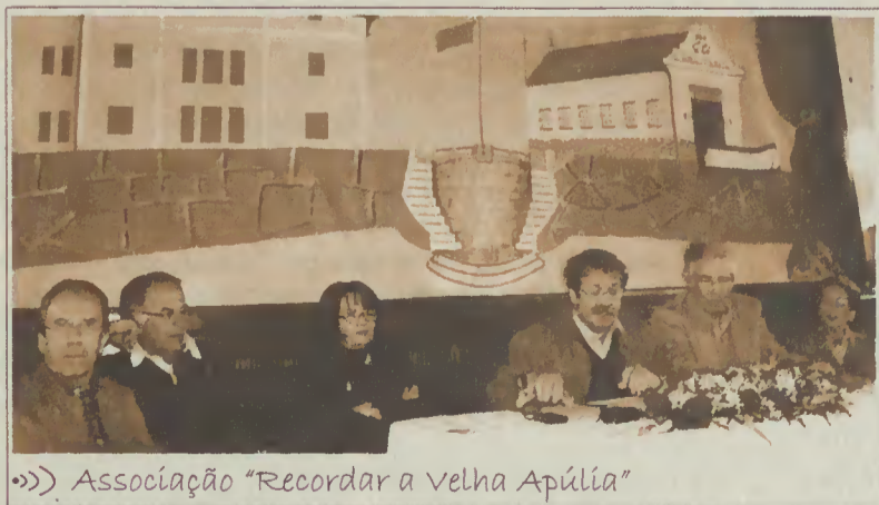
»»» Associação "Recordar a Velha Apúlia"

Foram muitos os associados que, das diversas regiões do país, se dirigiram naquele dia à Casa do Povo da Apúlia onde, numa assembleia muito participada, aprovaram um voto de louvor à Comissão Instaladora pelo