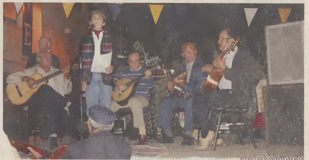
Cantou-se o Fado na festa da Tasca da Nazaré