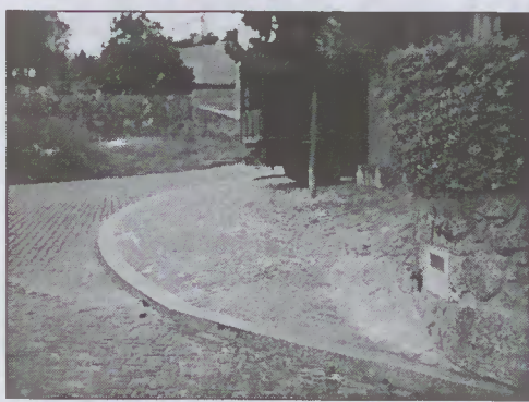
Fotografia da entrada para uma garagem junto à Sede de Junta.

Aperto de cruzamento, com acesso à Igreja Paroquial, em guias e calceta, com autorização da Autarquia, feito num sábado, até altas horas! E esta...!?