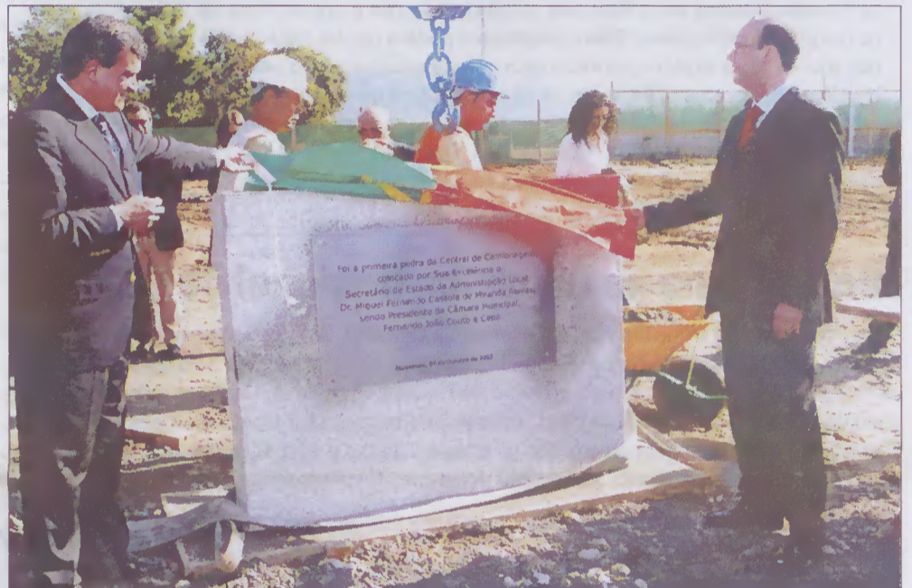
O lançamento da Primeira Pedra da Central de Camionagem

A inauguração das Sedes das Juntas de Freguesia de Antas e de Fonte Boa, o Lançamento da Primeira Pedra da Central de Camionagem de Esposende, a inauguração da Rotunda Norte da E.N.13 e a inauguração da Sede do Núcleo de Esposende da Associação Portuguesa de Paramiloidose marcaram a agenda do Secretário de Estado da Administração Local, Miguel Relvas, no passado dia 4 deste mês de Outubro, na sua visita de trabalho ao concelho de Esposende.