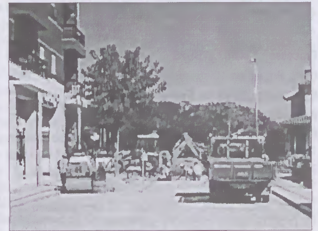
As obras na Av. Valentim Ribeiro

Delas estão a sair artérias com melhor piso, com mais espaço para os peões e esteticamente bem mais agradáveis. Os passeios são, fundamentalmente, feitos em calcário, com desenhos em granito.