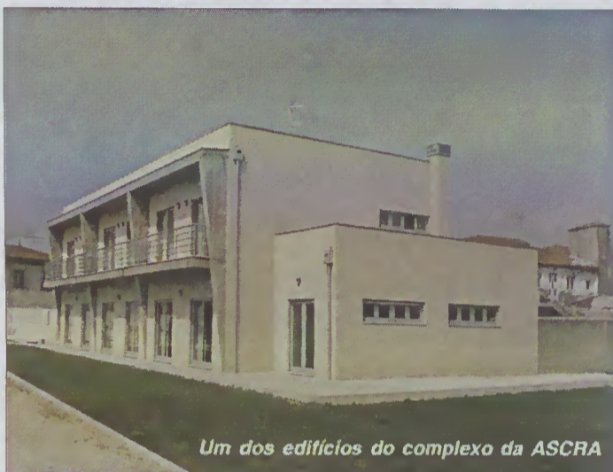
Um dos edifícios do complexo da ASCRA

Formação Conservação do Património Cultural" (Gastronomia Tradicional), em colaboração com o Centro de Emprego de Barcelos, culminando com o lançamento do livro