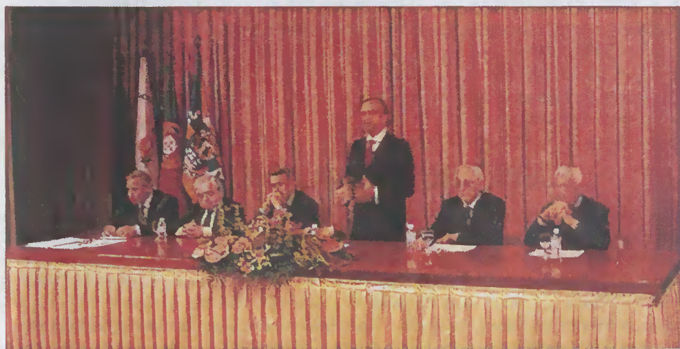
Sessão Solene, no Auditório da Biblioteca Municipal Manuel de Boaventura

No passado dia 29 de Março foi inaugurado, em Esposende, o Centro do Dador de Sangue Carlos Quinta e Costa, obra cuja investimento rondou os 100.000,00 Euros. Na cerimónia de inauguração participou, para além das entidades locais, o Presidente do Instituto Nacional de Sangue, Dr. José Almeida Gonçalves, que se mostrou muito satisfeito com o notável trabalho desenvolvido pela Associação Humanitária dos Dadores de Sangue de Esposende.