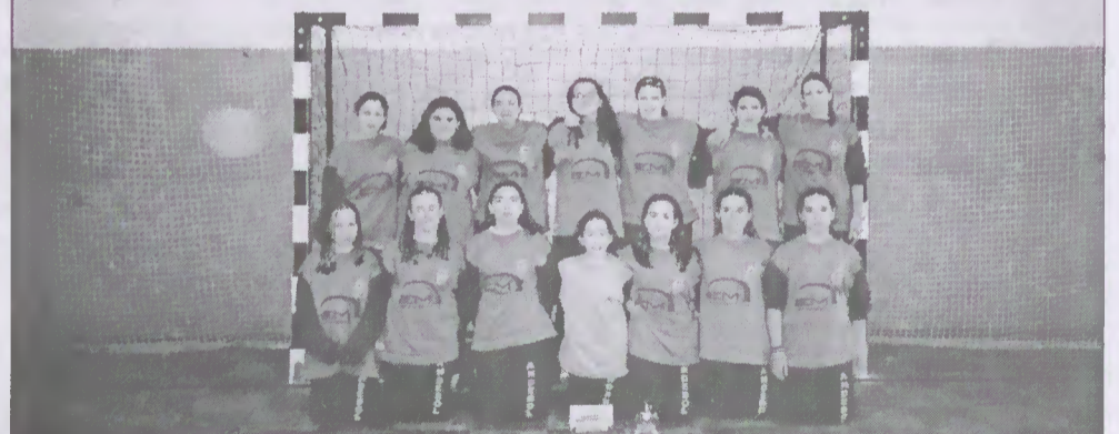
Iniciadas Femininas - Campeãs Distritais 2002/2003