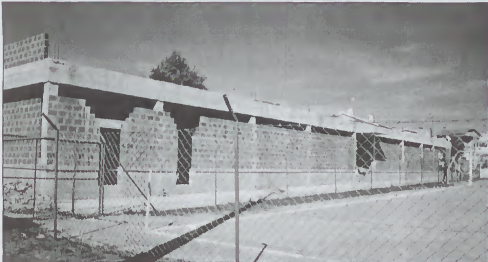
O novo Salão Social. Até aqui tudo bem, e agora?

Dentro das quatro linhas, o Antas Futebol Clube, que este ano disputou o Campeonato Distrital da I Divisão da Associação de Futebol de Braga, também esteve mal conseguindo apenas o penúltimo lugar na classificação da tabela. Na próxima temporada (2001/2002) vai disputar o campeonato com as equipas da II Divisão.