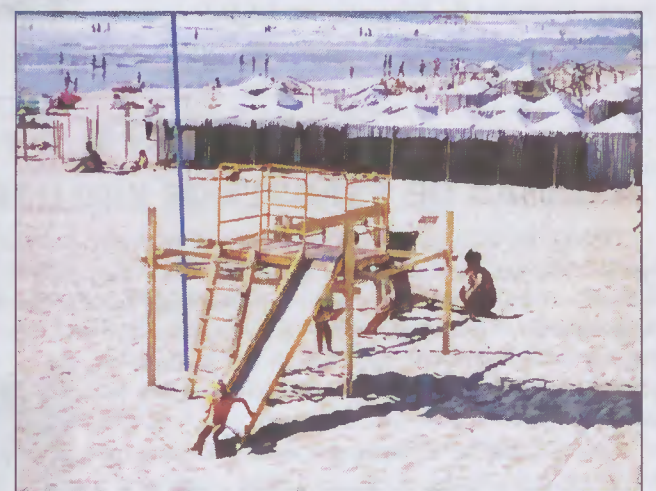
O equipamento decrépito