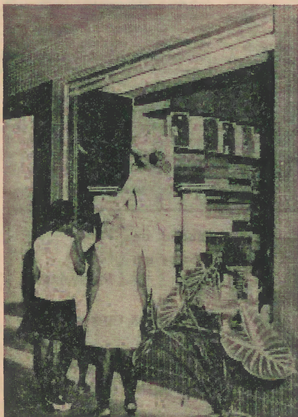
A gente de São Tomé ficou surpreendida e orgulhosa com o grande e belo edifício que acaba de ser inaugurado no centro comercial daquela cidade e cujas montras (especialmente as das modas) atraíram as jovens creolas, encantadas com os lindos e modernos modelos expostos. Bonita também, a begónia que decora o vaso, no primeiro plano, espécie em que a Natureza, nesta ilha, é pródiga.

Graças a Deus, nunca faltaram mordomos, que, voluntariamente se oferecem para fazer a festa da Páscoa. Além disso, promovem no seu ano a Festa da Imaculada Conceição — que é o dia da posse — e tomam parte activa em todas as festas da comunidade paroquial.