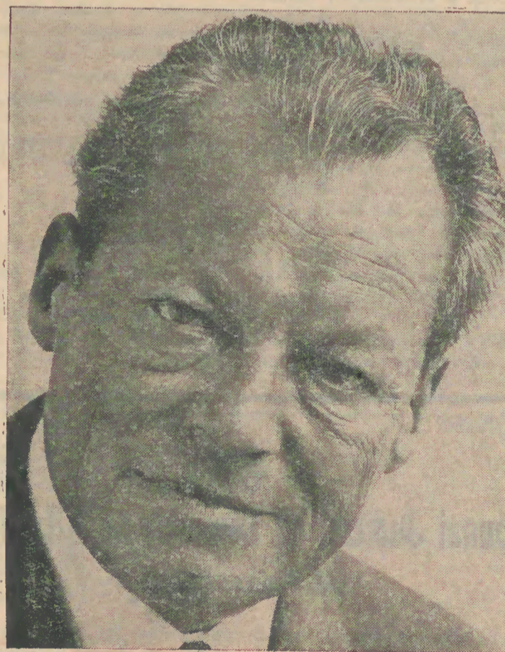
Um Europeu. Willy Brandt, Outubro de 1971. Nascido em 1913, em Lubeck, casado, 4 filhos. De 1933 a 1945 ocupação política e jornalística na Escandinávia. De 1945 a 1947 correspondente na Alemanha de jornais escandinavos. De 1957 a 1966 Burgomestre Regente de Berlim. Desde 1963 Presidente do Partido Social Democrático da Alemanha Federal. De 1966 a 1969 Ministro dos Negócios Estrangeiros da República Federal da Alemanha. Desde 1969 Chanceler Federal Alemão. Em 1970 «Homem do Ano». Em 1971 Prémio Nobel da Paz.

No final, tomarão posse os mordomos que farão as festas da Páscoa em 1972, dentro do verdadeiro espírito cristão.