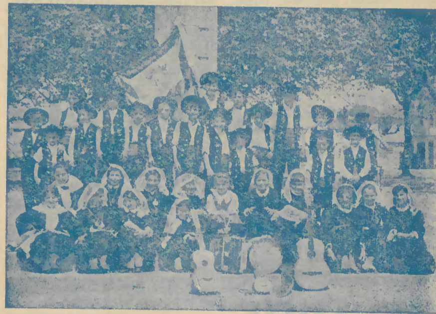
Rancho Típico Infantil de Vila Verde

Aos dirigentes e a todos quantos neste conjunto típico trabalham, queremos endereçar os nossos parabéns pela sua extraordinária actividade.