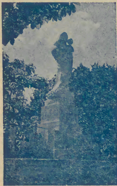
Imagem em pedra de Nossa Senhora do Alívio no recinto do Santuário

Neste ano, jubilosamente, abriremos as comemorações do Centenário do lançamento da primeira pedra para a construção do actual Santuário que fechará em 1972,