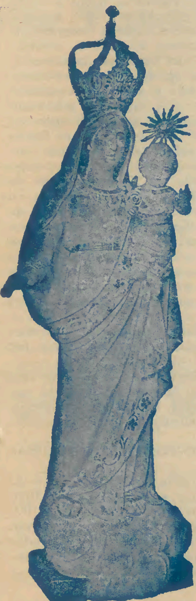
Imagem de Nossa Senhora do Alívio