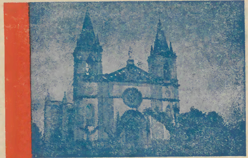
Santuário do Alívio