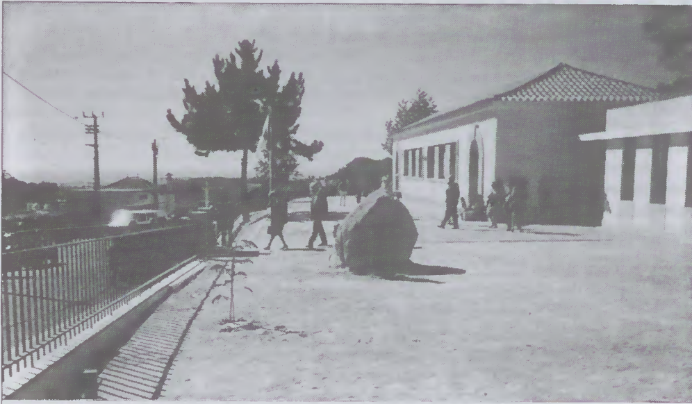
A Escola D. Maria Adelaide da Cunha Sotto Mayor Corrêa d'Oliveira é um luxo

Construída num terreno doado pela Casa de Belinho, em 1958, junto à capela de S. João, no lugar de Azevedo, a Escola D. Maria Adelaide da Cunha Sotto Mayor Corrêa D' Oliveira foi entregue à Delegação Escolar, no dia 27 de Junho, totalmente recuperada, contando agora com mais uma sala de apoio, cantina, mais dependências sanitárias e amplo espaço de lazer.