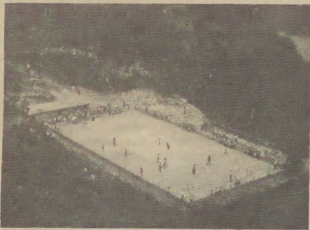
Vista panorâmica do campo polivalente da (A.C.D.R.V.) Associação Cultural, Desportiva e Recreativa de Valdosende, no Chamadouro

Foi a vez do desporto tendo-se realizado um jogo de voleibol entre a Associação e a P.S.P. de Braga e um de futebol de salão com